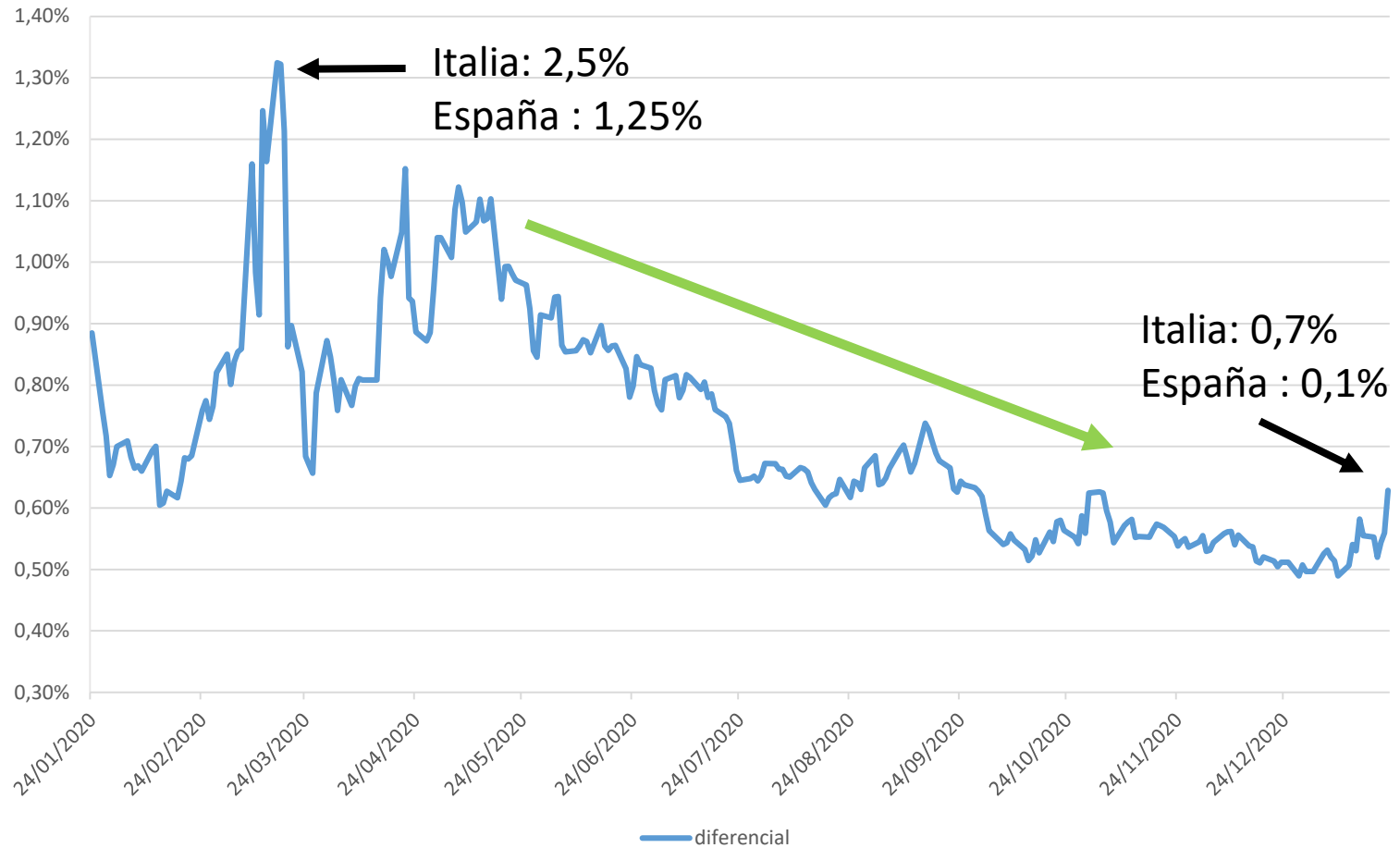
DIFERENCIAL BONO A 10 AÑOS ITALIA VS BONO 10 AÑOS ESPAÑA